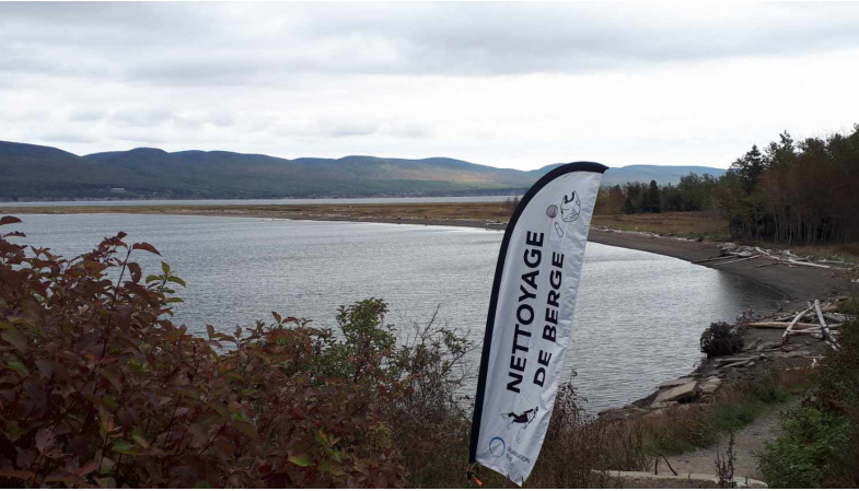
Qasqe'ke'l waqma'tmk. Ta'n wasoqitestoq. ta'n Comite ZIP Kespepe'.