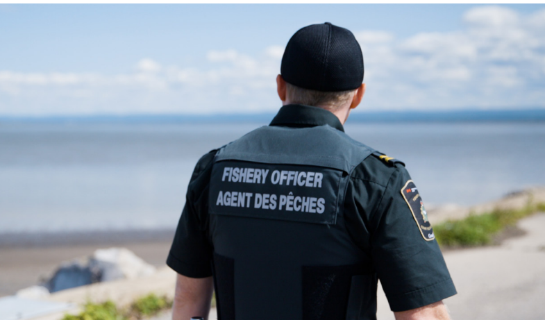
Ekwitamemkewey Kela'qa'tikete'w. Ta'n wasoqitestoq: DFO.

Wela'luksiek ula ta'n pesu'kwatmek wiaqa'tuwek pemiaq iloqaptikemk aqq anqa'tmk, ta'n MPA siawi total kepmite'tasik kelpitasik etek, ta'n toqi-lukwemk let ewe'mi'tij almi'jkat nikantek tel-lukwemkta'n westawiatmk marine-e'l ecosistemel.