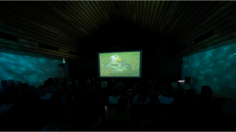
Piskwa'luksin teliaq. Ta'n wasoqitestoq: ta'n Comite ZIP Kespese'.