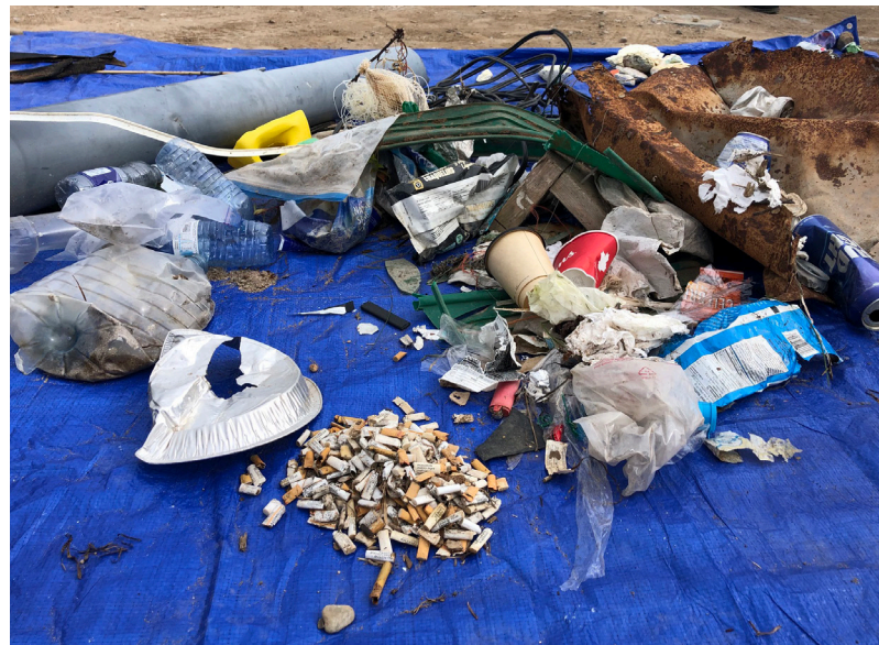
Ika'ql wejiaql ta'n Qasqe'ke'l kisi-waqma'tasik. Ta'n wasoqitestoq: Mi'kmawey Wolastoqey L'nuey Ekwitamemkewey Maliaptmk Toqi-lukwutimk.

Tel-lukwemkl wiaqtek ta'n eltasik aqq iknmuetasik ta'n na ekinu'tmasin kisitasik ukjit amalyjumkwemkewe'l nujo'tmi'titl ukjit we'minew ilapaqawemkewey online aqq offline, na ma'wt elt ta'n petkitasiksipnn ta'n seskwe'kl tabletel ukjit kisa'lan amalajumkwemkewe'l nujo'tmi'titl na mawte'minew ta'n-apaqtuk il-kwiluwasimk ewikasik ta'n na ilapaqawemk.