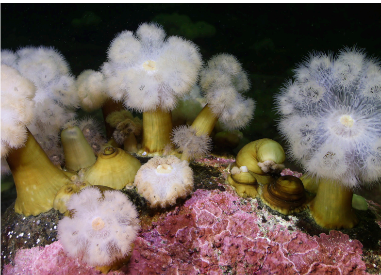
Plumose anemoneaq. Ta'n wasoqitestoaq; DFO kwetapia'tite'wk ta'n na Maurice Lamontagne-ey kina'mat-nuo'kuo'm.

Ta'n tel-lukwemkl ketmoqja'toq ta'n elukwemk aqq tepkispimk ta'n ekwitamemkewe'l apoqnmuekl aqq ta'n ila'lujik waisisk ta'n lukwaqna'lujik.