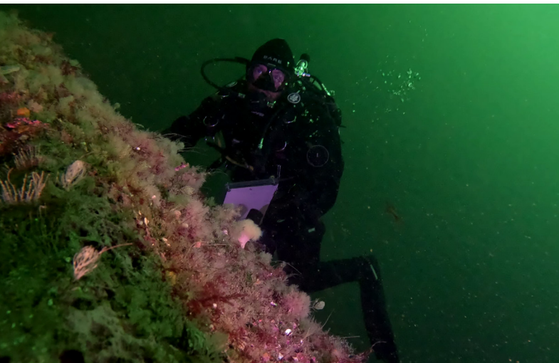
Scientificey kwetapiet. Ta'n wasoqitestoq: DFO kwetapia'tite'wk ta'n na Maurice Lamontagne-ey Kina'mat-nuo'kuo'm.

Ta'n Kipuk buoy na ika'tasis weja'tikemk Etquljuiku's we'kayiw Wikewiku's 2024 ta'n na BdA MPA, aqq na iknmuetoq siawtaqa'sik ewikasik ta'n na apaqtukewey weji-mikajultimk, putup eyk (sapteskl acoustical) aqq lampo'q meteta'q.