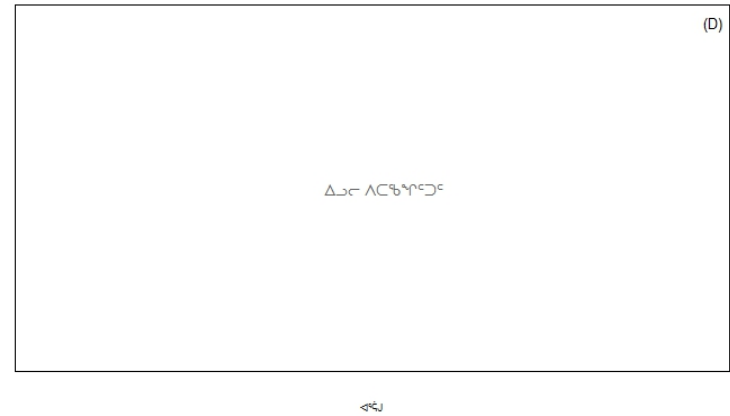
ቪዥኑ 3. Pandalus montagui የጋራ ንብረት ፍጥነት ለማረጋገጥ የሚያስፈልጉ ስራዎች። (A; የፈጠራ ሃይል) ለጋራ ንብረት ፍጥነት (ጠቅላይ ስራዎች ለ 24, 2024) ለጋራ ንብረት ፍጥነት ለማረጋገጥ የሚያስፈልጉ ስራዎች (TAC), (B; የፈጠራ ሃይል) የጋራ ንብረት ፍጥነት ለማረጋገጥ የሚያስፈልጉ ስራዎች (SSB) ለጋራ ንብረት ፍጥነት ለማረጋገጥ የሚያስፈልጉ ስራዎች (LRP; 3,100 ለጋራ ንብረት ፍጥነት) ለጋራ ንብረት ፍጥነት ለማረጋገጥ የሚያስፈልጉ ስራዎች (ለጋራ ንብረት ፍጥነት) የፈጠራ ሃይል ለማረጋገጥ የሚያስፈልጉ ስራዎች (USR; 6,100 ለጋራ ንብረት ፍጥነት), (C; ለጋራ ንብረት ፍጥነት ለማረጋገጥ የሚያስፈልጉ ስራዎች) ለጋራ ንብረት ፍጥነት ለማረጋገጥ የሚያስፈልጉ ስራዎች; (D; ለጋራ ንብረት ፍጥነት ለማረጋገጥ የሚያስፈልጉ ስራዎች) ለጋራ ንብረት ፍጥነት ለማረጋገጥ የሚያስፈልጉ ስራዎች