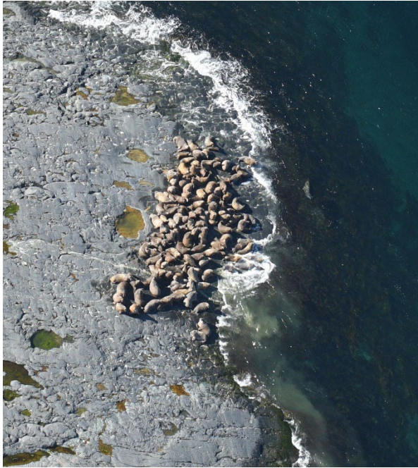
Des morses de l'Atlantique ont été transportés sur l'île Kidney lors du relevé aérien de 2022.