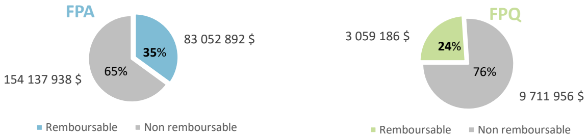
Contributions remboursables et non remboursables dans le cadre du FPA et du FPQ