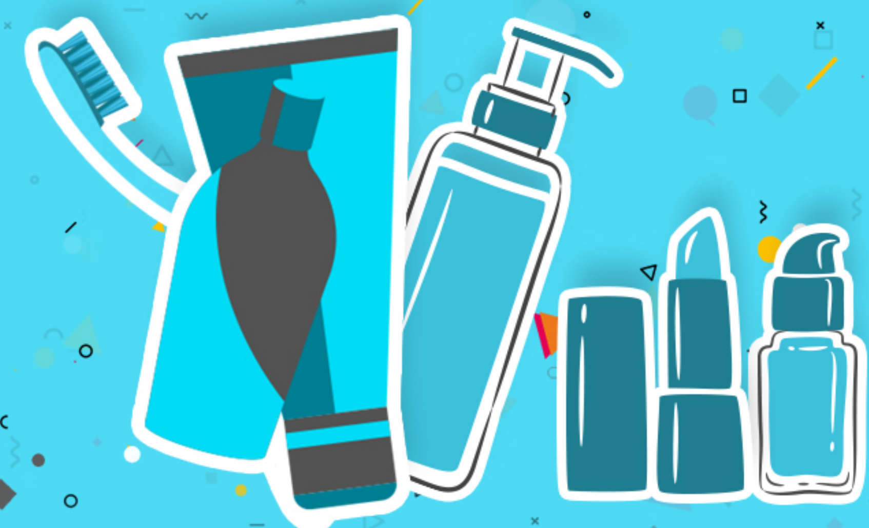
Produits de soins personnels