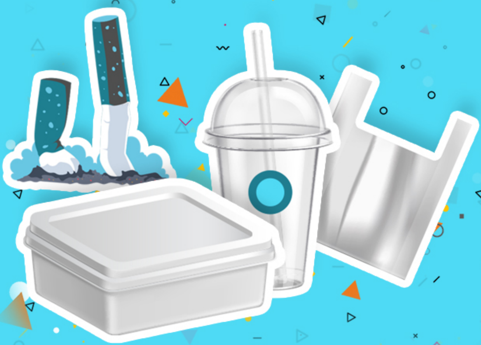
Plastiques à Usage Unique

PROVIENNENT D'OBJETS DE LA VIE QUOTIDIENNE