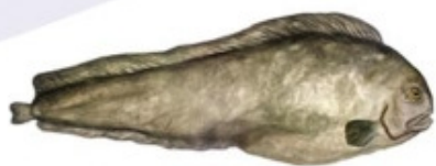
Loup à tête large

Évitez de laisser tomber les loups sur une surface dure. Remettez les à l'eau le plus tôt possible.