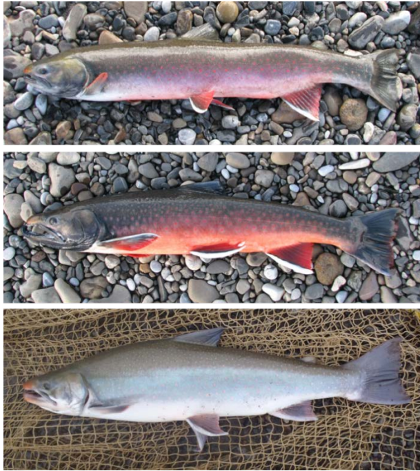
Dolly Varden (Salvelinus malma) de la rivière Rat : femelle après le frai (haut), mâle après le frai (milieu) et adulte non reproducteur « argenté » (bas).