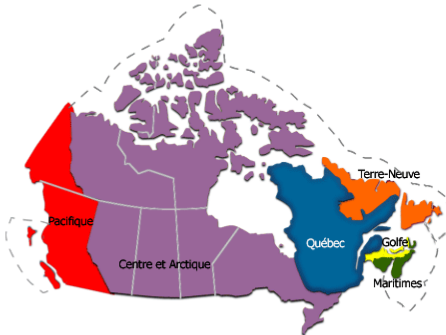
Figure 1 : Les six régions administratives de Pêches et Océans Canada.