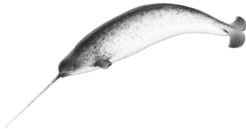
Narval Monodon monoceros