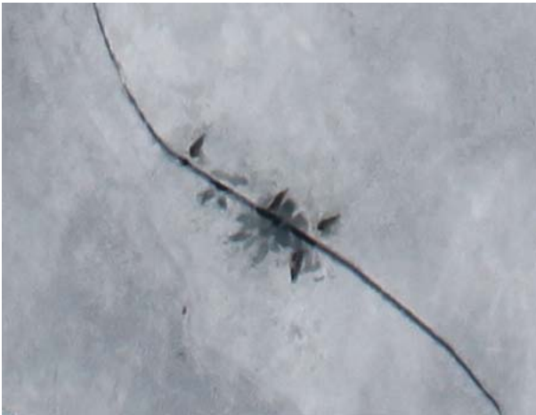
Relevé aérien de phoques annelés hors de l'eau le long d'une faille dans la glace de mer de la côte ouest de la baie d'Hudson.