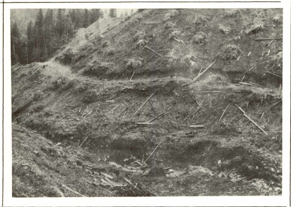
Fig. 1 Hand clearing and piling adjacent to a fish stream tributary. Access road is contoured to the slope. Ground vegetation is intact. Piles to be burned are small and well dispersed. Stream shows evidence of intermittent high flows and must be kept clear of debris accumulations to prevent scouring of erodible banks.