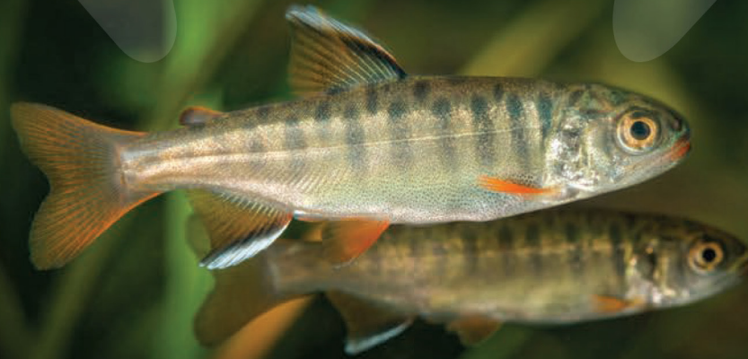
Tacon de saumon coho ( Oncorhynchus kisutch )